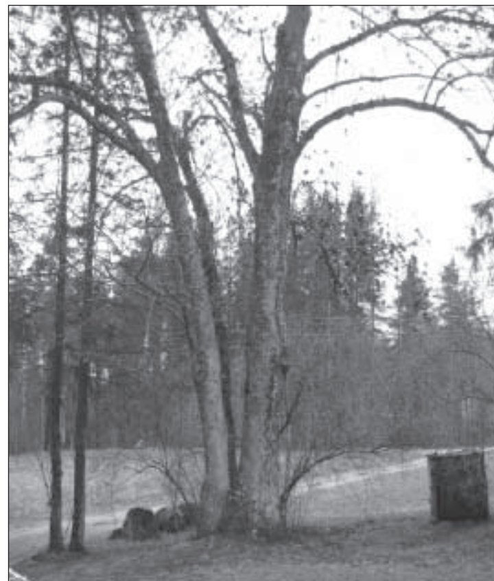
Kevadiselt veel raagus saarepuu.